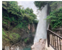
綿ヶ滝 すぐそばまで行くことができる落差32mの滝。