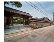
寺町寺院群 歴史を感じる佇まいが残る金沢最大の寺院群。

ひがし茶屋街近くの「西養寺」をふりだしに、双六の名所周辺を観光しながら「あがり」の「白山比咩神社」へ。名店での昼食、「開炉裏の宿「和田屋」での宿泊で、白山参詣道を満喫。