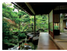
武家屋敷跡 野村家 百万石の面影を残す建物と庭園が見事です。