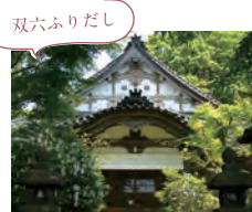
西養寺 金沢市街を一望できる由緒ある寺院からスタート。