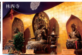
林西寺 神仏分離で霊峰白山から下ろされた仏像を拝観。

設定期間 通年 最少受付人員 2名 最大申込人員 4名 設定除外日 月、第1・3・5日曜日 予約締切 1週間前 運行タクシー会社 石川近鉄タクシー