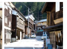
白峰の街並み 白山麓の重伝建地区でガイド付き散策と昼食を。

設定期間 4月～11月 最少受付人員 2名 最大申込人員 4名 設定除外日 水曜日 予約締切 希望日の前月20日 運行タクシー会社 石川近鉄タクシー