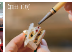
名工の工房で獅子頭根付けに絵付けし、お土産に。

設定期間 4月中旬～11月中旬 最少受付人員 2名 最大申込人員 4名 設定除外日 日、火、水曜日 予約締切 1ヶ月前 運行タクシー会社 石川交通