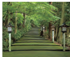
白山比咩神社 表参道 全国に3000社以上ある白山神社の総本宮。