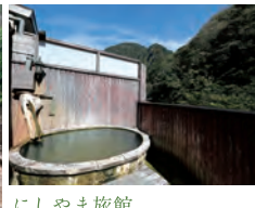
にしやま旅館 胃腸の湯、美肌の湯として知られる秘湯で宿泊。

城下町の庭園美を鑑賞し、秘湯の宿で静かな一夜を。「白山白川郷ホワイトロード」をドライブし、世界遺産白川郷へ。