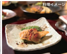
高砂茶寮 酒蔵を改装した部屋でコース料理をいただきます。