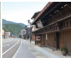
醸造のまち鶴来 四大醸造がそろう街を地元観光ガイドと散策。