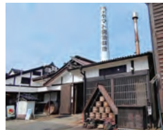
ヤマト糍パーク 榎ヤマト醤油味噌の本店で試食・試飲、お買い物。