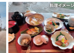
仁志川 金沢の眺望を愛でつつ、「小横石白山」を召し上げ。絵付けし、お土産に。