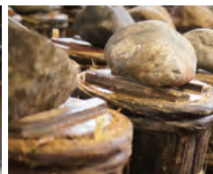
あらと 奇跡の発酵食といわれる「ふぐの糠漬」の製造を見学。

設定期間 通年 最少受付人員 2名 最大申込人員 4名 設定除外日 日、火、水曜日 予約締切 1週間前 運行タクシー会社 富士タクシー