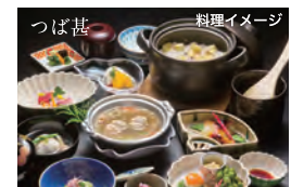
つば甚 金沢を代表する老舗料亭で昼食席をご堪能ください。

金沢市の「ひがし茶屋街」と「主計町茶屋街」を巡って老舗料亭で食事。日本三大袖「牛首袖」の工房訪問など「白山市」の「白峰」をゆっくり体感。