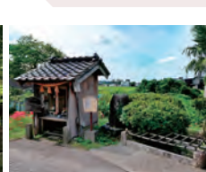
手叩き清水 双六の正式名「手擲清水参並白山詣」とある重要地。