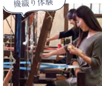
白山工房 日本三大袖の「牛首袖」工房見学と機織り体験。