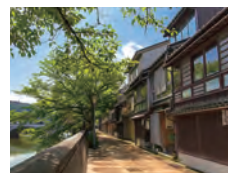
主計町茶屋街 浅野川沿いに風情ある街並みが続く茶屋街。