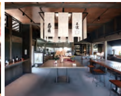
天狗舞 CRAFT SAKE SHOP mau. 銘酒「天狗舞」の蔵元で、大吟醸を飲み比べ。